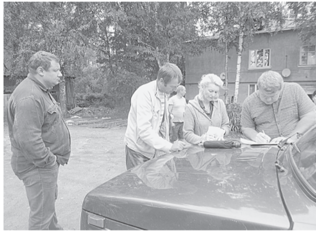
Все недоделки строителей занесли в акт