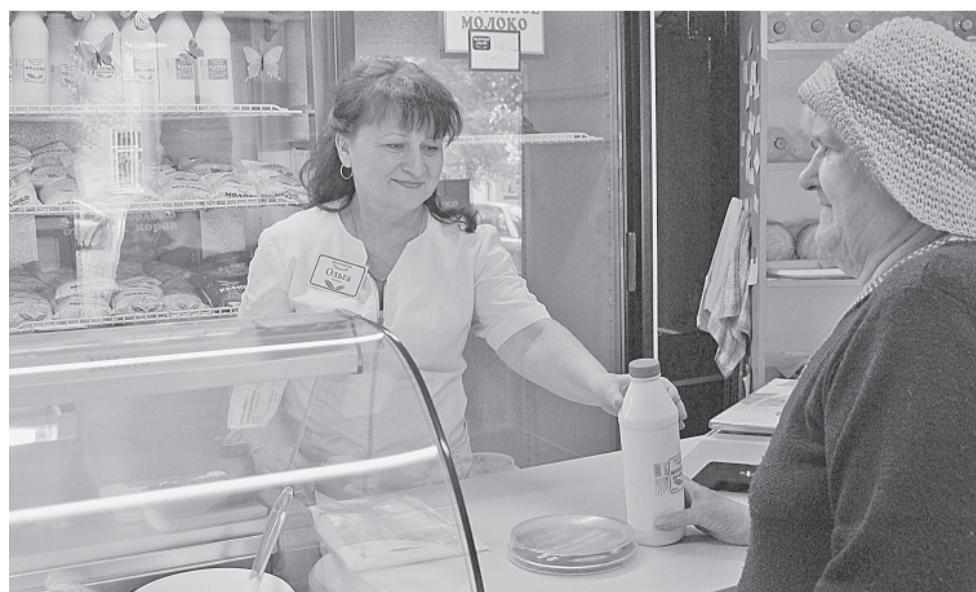
В магазинах «Молочного дворика» встречают приветливо