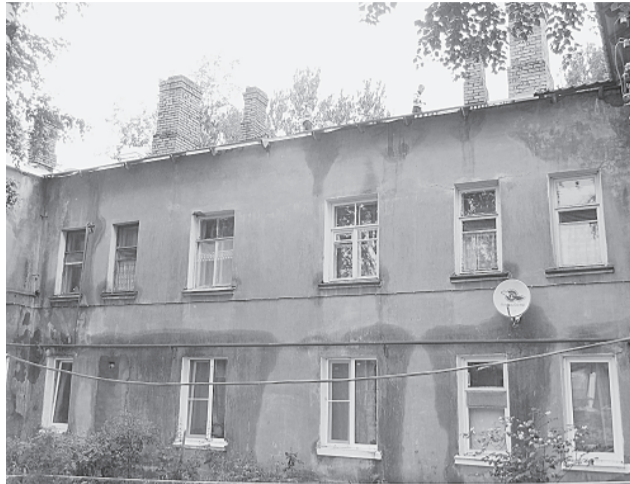
Стены дома в результате ремонта промокли

лом и поквартирно. Как выяснилось, подрядчик начал работать на Загородной ещё в апреле. Жители отмечают, что поначалу работники из местных (их было 4-5 человек) трудились бойко, задерживались до темноты, однако, спустя какое-то время пропали. Уже больше полутора месяцев ремонт крыши не ведётся, хотя срок сдачи работ был запланирован на конец июня. Организация реагировала, и то не всегда, только на жалобы о протечках: рабочие приходили, подставляли емкости под стекающую воду на