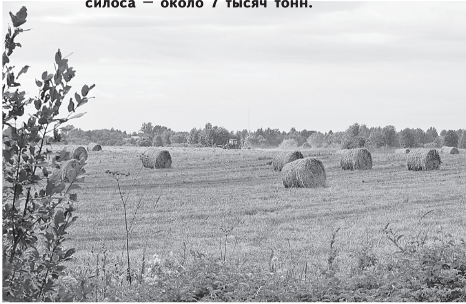
Сенаж в рулонах сохраняет большое количество полезных элементов

В крестьянских хозяйствах района заготовлено 860 тонн сенажа, в том числе в упаковках — 360, силоса — около 7 тысяч тонн.